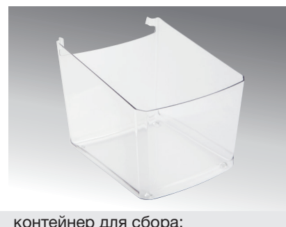
контейнер для сбора;